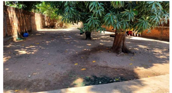
Buitenplaats Casa Girassol