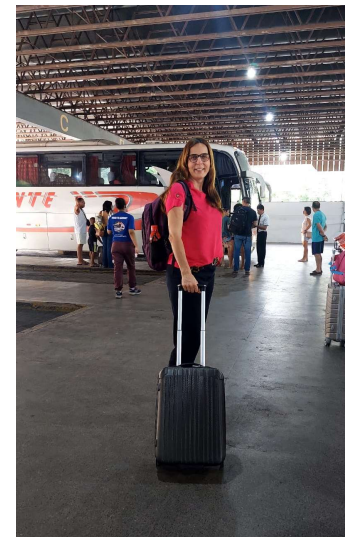
Op reis naar Piaui

“Ter opbouw van Gods Koninkrijk, verspreiding van het blijde evangelie en de redding van verloren zielen”