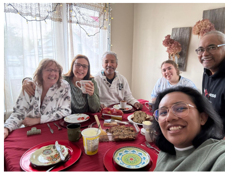
“vroegere Nederlandse oppas”.