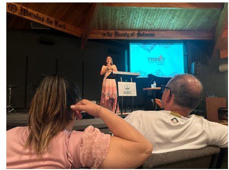
Spreken op een conferentie