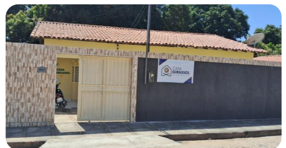
De voorkant van ons nieuwe huis in Piauí