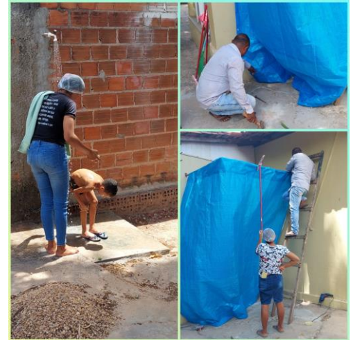
Douchegelegenheid voor de jongens: