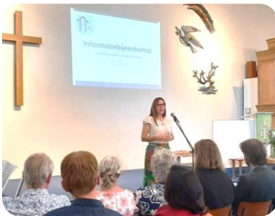
Het was fijn u te ontmoeten!

Van juni op juli ben ik een paar weken in Nederland geweest. Het was een goede tijd. Ik heb het ontzettend fijn gevonden om een aantal van u op de Horeb-dagen te kunnen ontmoeten. Tijdens het “koffiemoment” is het altijd fijn om even persoonlijke gesprekken te hebben. Een aantal van u heb ik helaas niet kunnen ontmoeten, wat ik echt heb gemist. Hopelijk bij een volgende gelegenheid. Ik heb de 3 weken in Nederland zo goed mogelijk geprobeerd te benutten: bezoeken, Horeb-dagen, gesproken in gemeenten, bestuursvergadering gehad, individueel werkoverleg met bestuurders en natuurlijk familiebezoek. Een volle maar goede agenda.