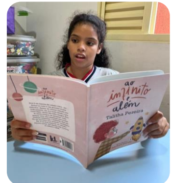
Onderwijs, spelletjes en huiswerkbegeleiding